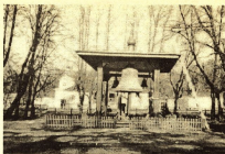
Звонница в Олимпийской пустышке

Сдрогнулось вчера, было, сердце мое, И во всем разуверилась, было, душа — Я увидел беспечных ликом житье И опять поосвидовал им за глаза. Никогда не тревожат их скорби и плач, Им до смерти величие и дерзость даны, Веселит их собрание яркой кумач, Когда людям полиша еще до бед. Откровенно, без страха лукавят всегда, Затененные помыслы пряха свои, А когда издеваться начнут свысока, То слова их подобны фонтану воды. К небесам подниматься был этой струе, И сверкая на солнце, и разду глаз, Но она припадает к могучей земле И разводит повсюду болотную грязь. И народ, замутив по лесам родники, Эту воду мертвящую с жаждостью пьет, Говорит: «Как несведущи были отцы.