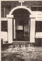
Вход в храм