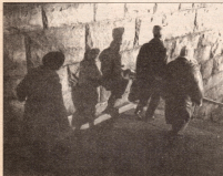
Куда нам идти...