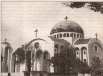
Кафедральный собор в Сеуле

17 апреля 1903 года в районе Чонг-Донг (центр Сеула) была торжественно