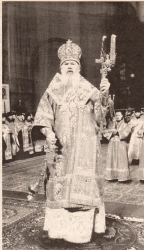
Воскушение в храме Христа Спасителя

ром учения были верующими людьми! А сколько православных православных священ в современности знали различные системы веры? Настоящие знания не могут проигнорировать веру. Они утверждали путь к вере, и вера-содержит древнее знание для познания. Таким образом, вера и знание помогают друг другу и corroborate ради исполнения главной цели человека — это спасение в вечности.