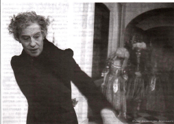
Сцена из фильма «Вал»

не народа, культуры и проч., особенно актуальным в глазах иностранца. Можно выделить два основных сюжетных хода.