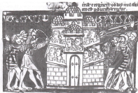
Средняя азиатская степь. Миниатюра из французской рукописи XIV в.