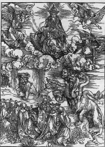
«И поклонится ему все живущие на земле, которых имена не написаны в книге жизни» (Откр. 13:8). Гравюра А. Дюрера

М. В.: Ну значит, пока мы можем говорить лишь об Апокалипсисе постматериала, И действительно, не нам прогнозировать о том, когда это послеполитика наступит.