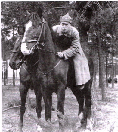
Левые не дремлют

военным путем: разгромить страны, являющиеся опорами терроризма (прежде всего, Саудовская Аравия, другие страны Персидского залива, Иран, Пакистан, Турция) вполне возможно, но контролировать их огромные территории нельзя и общими силами антитеррористической коалиции. Кроме того, террористические организации, лишь опирающиеся на помощь национальных правительств, настолько законспирированы, децентрализованы, автономны в финансовом отношении и многочисленны, что подобные меры сами по себе лишь сыграли бы им на руку. Члены антитеррористической коалиции разрозненны: о какой-либо надежности Европы нельзя говорить, а пять главных антиисламистских держав — США, Россия, Израиль, Индия и Китай — разделены инерцией старых конфликтов и неанализируемыми спорными связями с исламистскими странами.