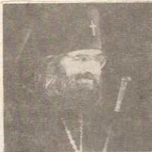
Архиепископ Иоанн (Максимович)

Блаженный Иоанн запомнился всем своей жизнерадостностью, простотой, особенно при общении с детьми, своим легким малороссийским юмором. Владыка даже внешне походил на ребенка, только с густой бородой, — низкорослый, немного неуклюжий. Часто после богослужения он шутил с мальчишками-прислужниками, слегка постукивая непослушных по