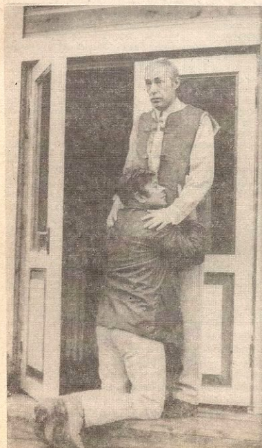
Кадр из кинофильма "Солярис" Андрея Тарковского