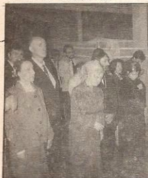
“Молитвы родителей утверждают основания домов.”