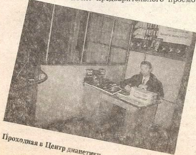
Проходная в Центр дианетики

— У меня было много нерешенных проблем, и семейных, и профессиональных. И вот как-то я прочитал