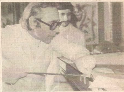
Лабораторное изучение Плащаницы

Это могло произойти в 1532 году, когда Плащаница сильно пострадала от пожара в соборе французского города Шамбэри. Серебряный ковчег, где она