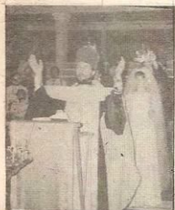
“Господи Боже наш, славою и честью венчай их.”

и прилепится к жене своей; и будут одна плоть.” (Быт. 2:24)